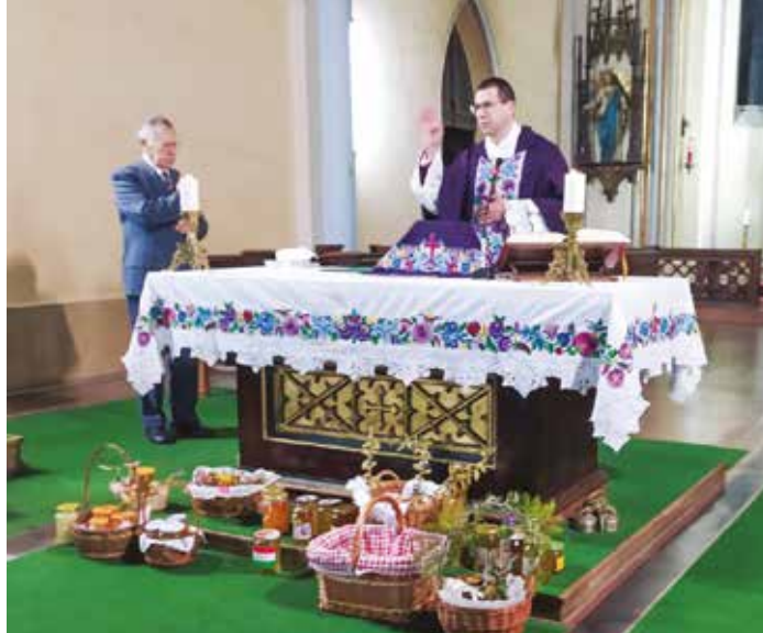
Március 10-e a méhek napja

A március 7-én megtartott mézszentelő szentmisén sok kör-