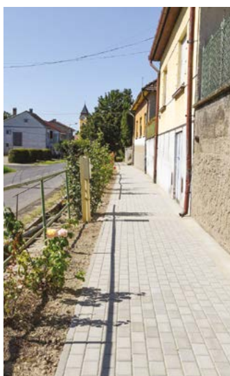
A járdafelújítás folyamatos a településen.