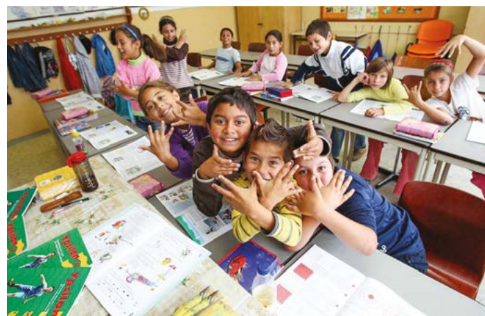
A fejlesztés a város szegregált, többnyire a roma lakosság által lakott városrészeire irányul. (Illusztráció)

körülmények javítása, az élhetőbb lakókörnyezet kialakítása érdekében öt szociális bérlakást korszerűsített a Malomszögi utcában. A Hősök útján a régi, rossz állapotban lévő Cigány Nemzetiségi Önkormányzat irodaépületének elbontását követően egy új közösségi ház épül, melynek az udvara is megszépül. A gyermekek számára részlegesen felújítják a Szőlők közeli Sportcentrum területén lévő játszótér.