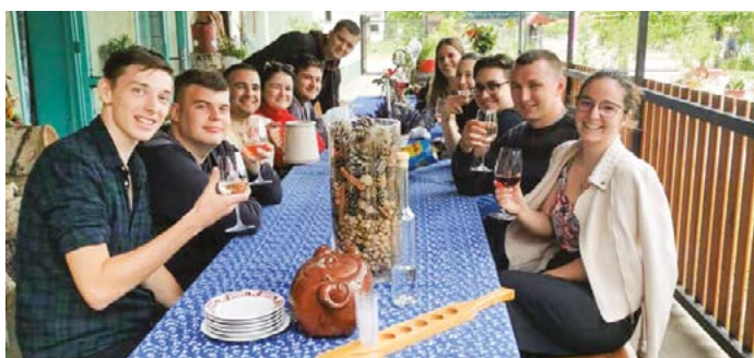
Az SK Borászatban előre egyeztetett időpontban fogadnak kis csoportokat borbemutatóra, borvacsorára.