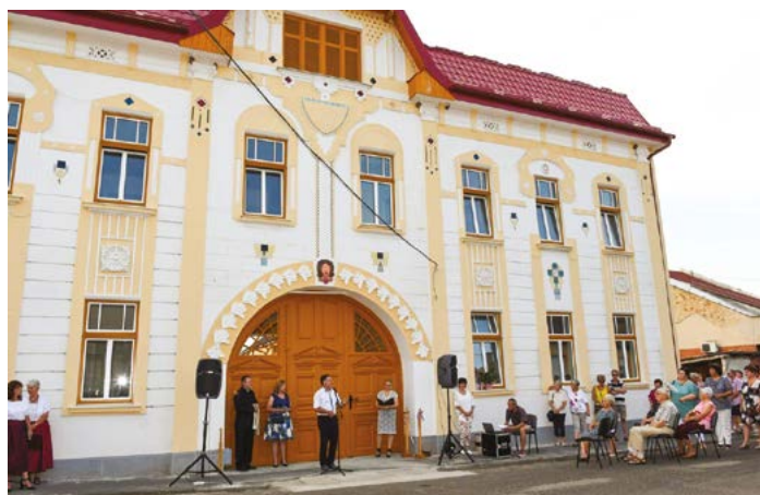
A Sváb Értéktár szép tiszteletadás a felmenők előtt.

– Egy nagyon mozgalmas és tevékeny esztendő utolsó negyedében is tele vagyunk tervekkel. A TOP energetikai pályázatán nyertünk 120 millió forintot a Polgármesteri Hivatal felújítására. Az épületre nagyon ráfér a fejlesztés, a pályázat megvalósítása sok feladatot fog adni a következő évben. Nemrégiben beadtuk a német nemzetiségi pályázatokat, aminek segítségével az oktatási intézményeinkben szeretnénk a körülmények minőségi javítását elérni. Az óvodában tornatermet építenénk, az iskolát pedig kifesténnék. November 13-án lesz a legközelebbi nyitott pincék esemény, amit szeretnénk egy libafutammal ötvözni. Ez öt kilométer futást, gyaloglást, vagy kerékpározást jelent. Két évvel ezelőtt rendeztük meg először, akkor eljöttek több mint százán, és nagyon jó hangulatban telt. Bízom benne, hogy most sem lesz másként. November 14-én a időseinket köszöntjük fel, és készülünk már a karácsonyi, adventi, újévi programokra is. Annyit már elárulhatok, hogy január 8-án a ráckevei Lohr Kopelle fúvószenekar ad koncertet a templomban. Ezzel szép zenei élménnyel nyitjuk meg az új évet bizakodva és abban reménykedve, hogy 2022 új sikereket és tartalmas közösségi programokat tartogat a település és a császártöltésiek számára. Tajola-Tóth Timea