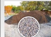
CSEH FEKETE DÍÓ SZÉN – Lakossági célra 20/40 mm szemcsenyagúságú