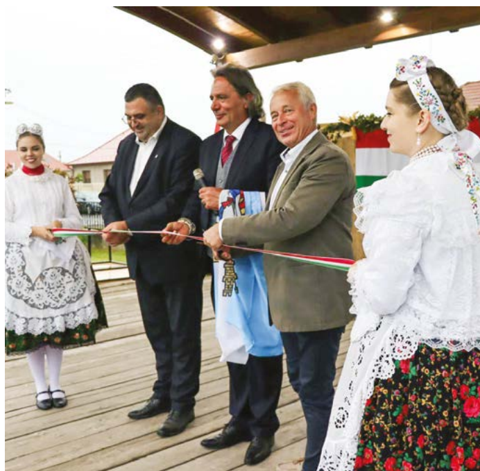
A Falunapon jelképesen is átadták az óvoda, a konyha és az orvosi rendelő energetikai korszerűsítés beruházását.