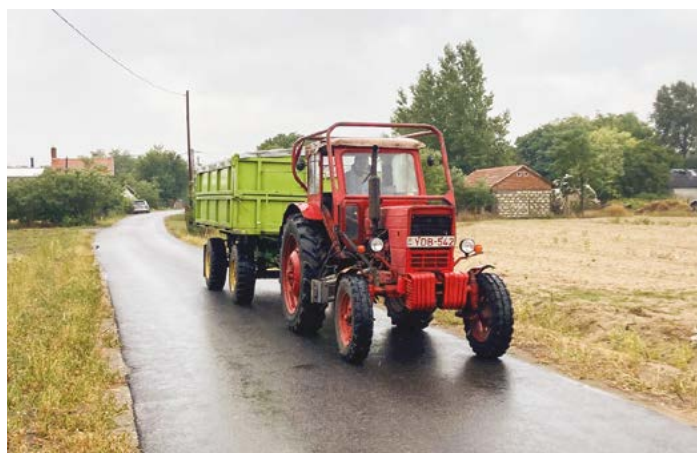
A mezőgazdasági területekhez, tanyákhoz, ültetvényekhez vezető utak aszfaltozása régi igénye, kérése volt a helyi gazdálkodóknak.

Még 2018-ban került pecsét arra az okiratra, melyben Magyarország Kormánya támogatásáról biztosítja Kiskőrös