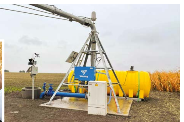
Az okos információs rendszerben távirányítással, előre programozással lehet meghatározni, melyik területre öntözzék.