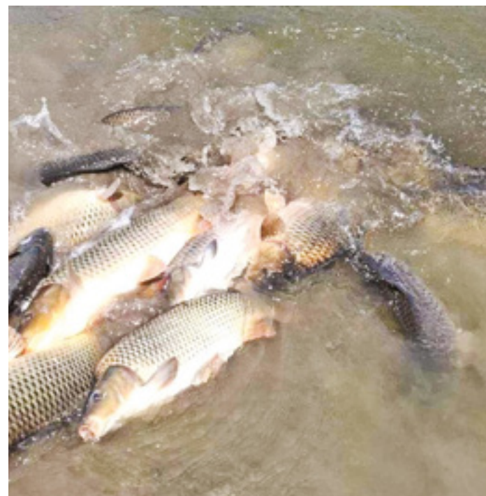
Évente 100 mázsa pontyot telepítenek a Vadkerti-tóba.

Gazdasági helyzetünk egyelőre nem alapoz meg nagyszabású terveket, de nyitottsággal és ötletekkel várjuk a pályázati lehetőségeket. Addig is fő célunk az egyesület összetartása, működésének fenntartása. Továbbra is terveink között szerepel versenyek, baráti összejövetelek, horgász táborok megrendezése. Számítunk minden egyesületi tagunkra, akiket ezúton is arra kérek, hogy ki-ki a maga módján és lehetőségei függvényében segítse, támogassa közös vállalkásunkat! A legfontosabb, hogy ne legyenek súlyos ellentétek horgász és horgász között, s hogy érvényesüljön az elnökség jelmondata, miszerint minden forint számít, minden segítő kéz épít. Horgásztársaimnak pedig ezúton is azt kívánom, hogy görbüljön!